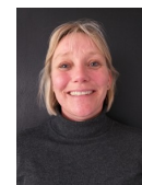
Lone Pædagog koordinator