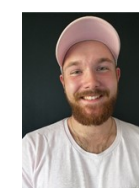
Casper pæd. Medhjælper